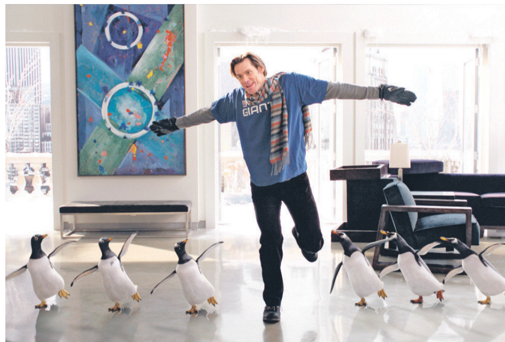
PAN POPPER A JEHO BAND. Jim Carrey s šestkou tučňáků, s nimiž si štáb při natáčení dost užil.

Jednoho krásného dne se však stane něco, co jeho život obrátí naruby. Do domu doputuje podivné dědictví jeho otce. Přímou do obýváku mu pošta doručí neočekávanou objemnou bednu. A za ní dalších pět. Šest velkých útočišť, které posléze odhalí své tajemství – šest živých tučňáků, které panu Popperovi odeslal otec rovnou z Antark-